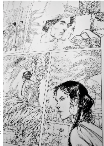
Planche MURINA sans encrage

L'orientation d'Édition Dargaud a permis de donner un nouveau souffle à la bande dessinée. Car dans plusieurs genres, elle a permis de donner une place de préférence à la bande dessinée. La liste de genres sur lesquels Dargaud a été le plus innovant : Black Histoire , Polar / Thriller , Biographie / Documentaire , Fantasy . La bande dessinée, qui est très importante pour nous, mais aussi que l'histoire raconte est le style et le traitement graphique. (dans les illustrations, les visuels, les couleurs et dans les couleurs, c'est principalement ce qui propose une maison d'édition qui correspond vraiment à nos valeurs (surtout la qualité) et créative.